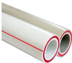
Труба PN25 SDR 6 Optimum